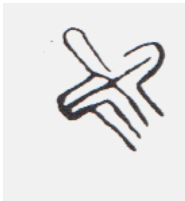
Stjernefigur som viser sjamanen som reiser til den andre verden

Det er også klare likheter mellom typiske figurer på helleristningene i det vestlige og sør-vestlige USA og figurer på Storsteinen og andre helleristningsfelt i Alta. Dette er en stjernelignende figur som i det sør-vestlige USA er tolket som et tegn for sjamanen som reiser til den andre verden. En annen typisk figur på helleristninger det vestlige USA er “rockbaby” eller en spøkelses- eller uglelignende figur som opptrer som sjamanens hjelper og som finnes på helleristningsfeltet på Amtmannsnes i Alta. I tillegg finnes typiske beverfigurer på helleristningene i Alta nord i Norge og sør-vest i USA – og beverfiguren finnes igjen på runeboommene fra 1700-tallet.